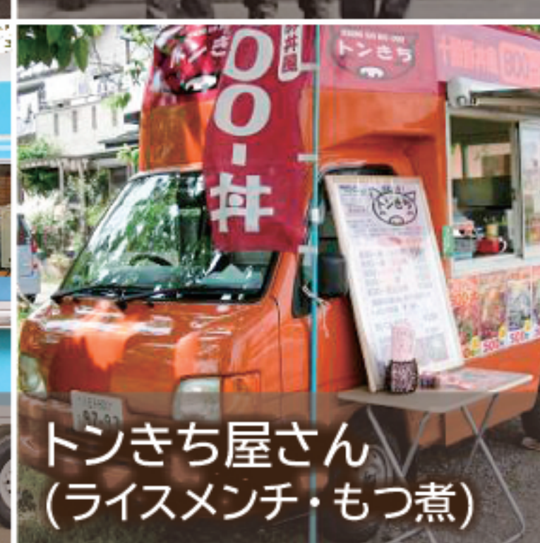
トンきち屋さん (ライスメンチ・もつ煮)