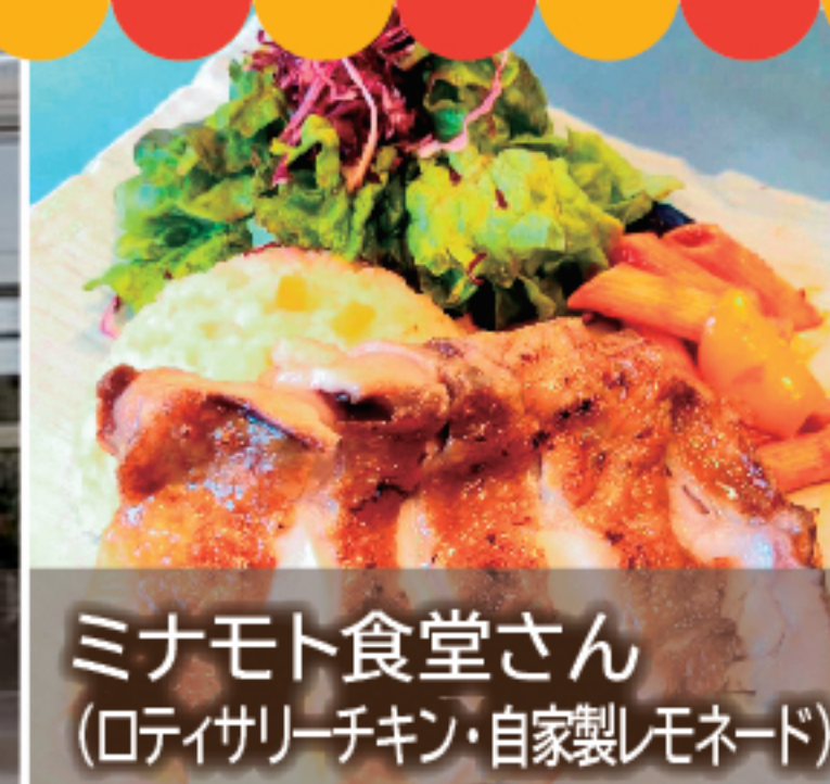
ミナモト食堂さん (ロイヤルチキン・自家製モネード)