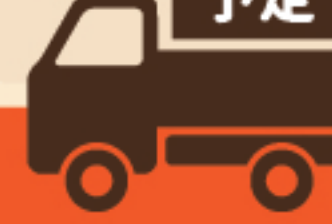
お茶っこサロン一煎 さん

2011年に始まった所沢西高校といわき海星高校の被災地ボランティア。出品する「狭山茶ぼーぼーバーガー」はそんなボランティア活動の一環で入間市の狭山茶、いわきの魚を使ったぼーぼー焼きを組みあわせ生まれた商品です。今回、スマイル農場のフリルレタスを挟んだ限定コラボバーガーとして販売します！