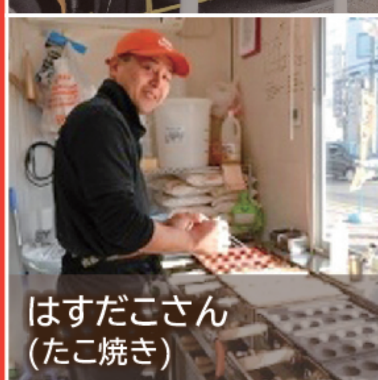
はすだごさん (たこ焼き)