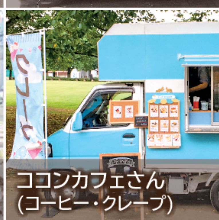
ココンカフェさん (コーヒー・クレープ)