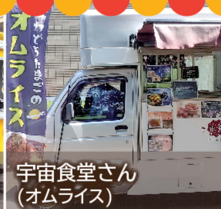
宇宙食堂さん (オムライス)