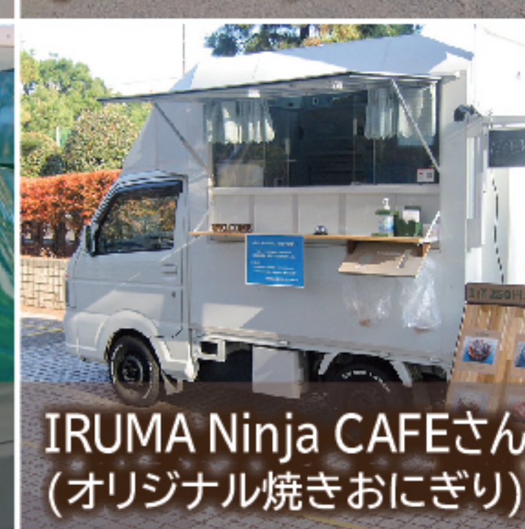
IRUMA Ninja CAFEさん (オリジナル焼きおにぎり)