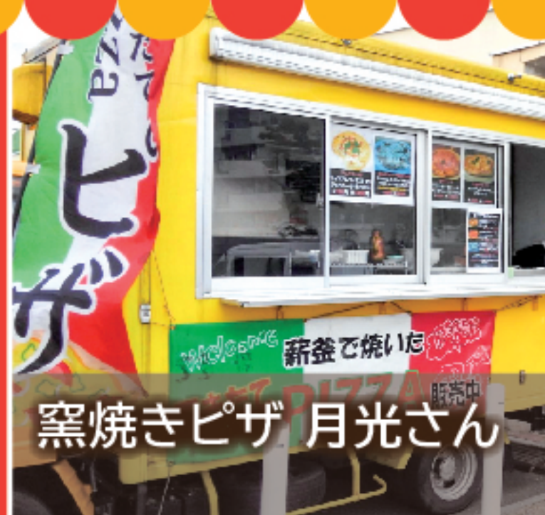
窯焼きピザ 月光さん